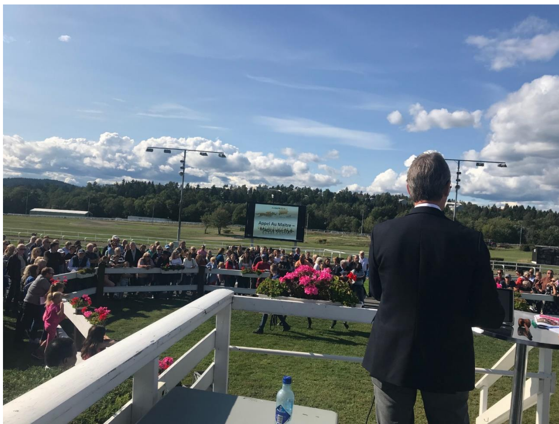
Bilde: auksjon på arrangert på Øvrevoll tidligere år. Nå avholdes en skandinavisk auksjon i Danmark hvert år.

Det er også på plass en tilskuddsordning dersom man ønsker å importere en drektig hoppe slik at man får et norskoppdrettet føll. Mer informasjon om dette kan finnes bak i denne veiledningen.