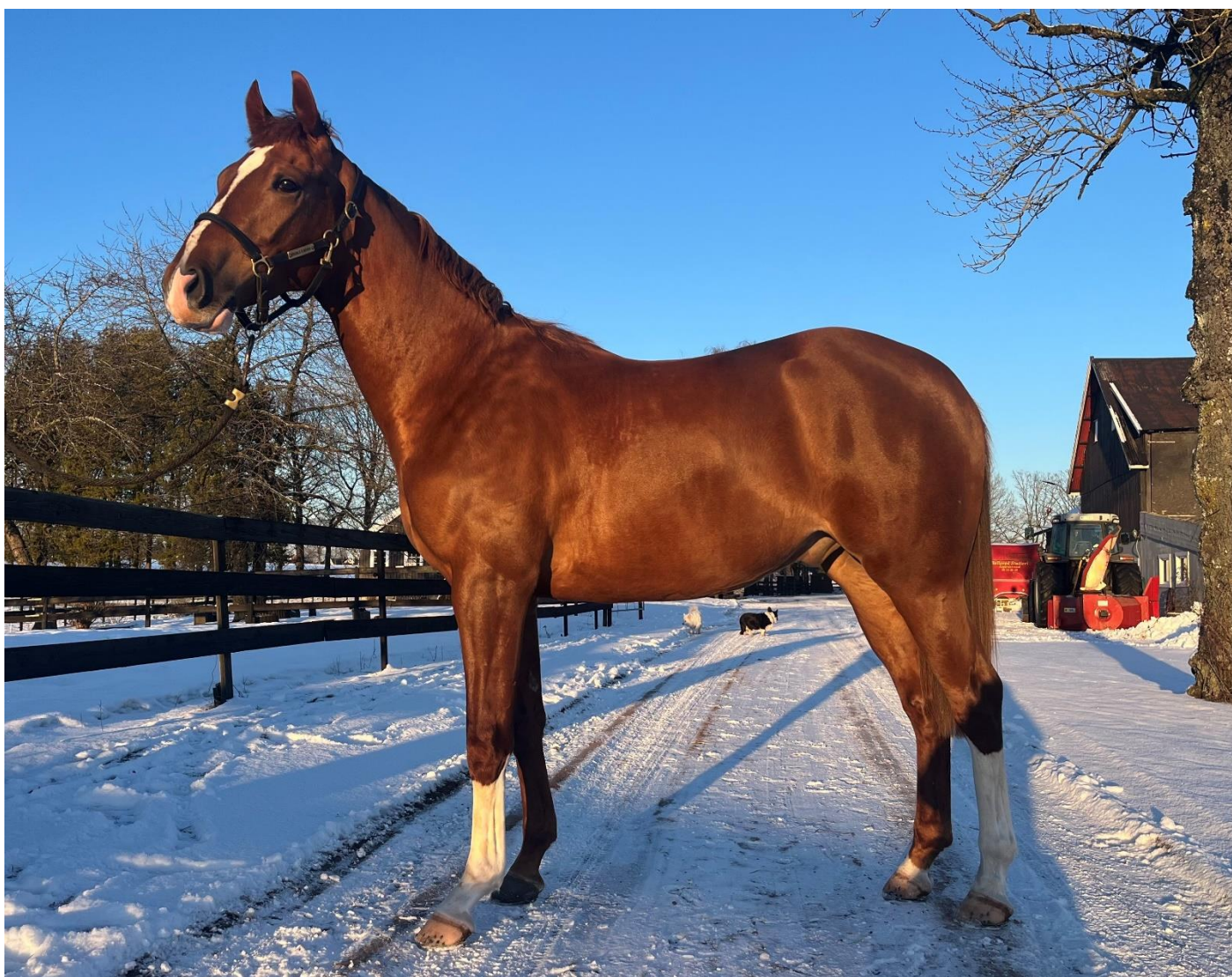
Munch, født 2023 etter Caprioli (GB) – Costasera. Oppdretter Bollerød Stutteri.