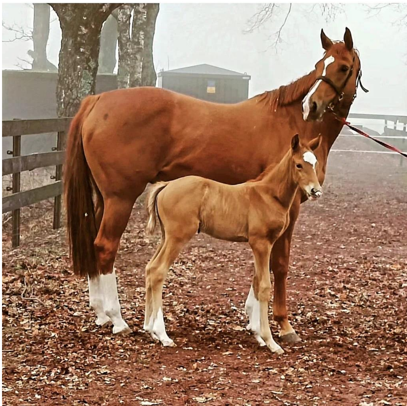
Hoppeføll født 2024 etter Caprioli (GB) – Costasera. Oppdretter er Bollerød Stutteri i Åsgårdstrand.