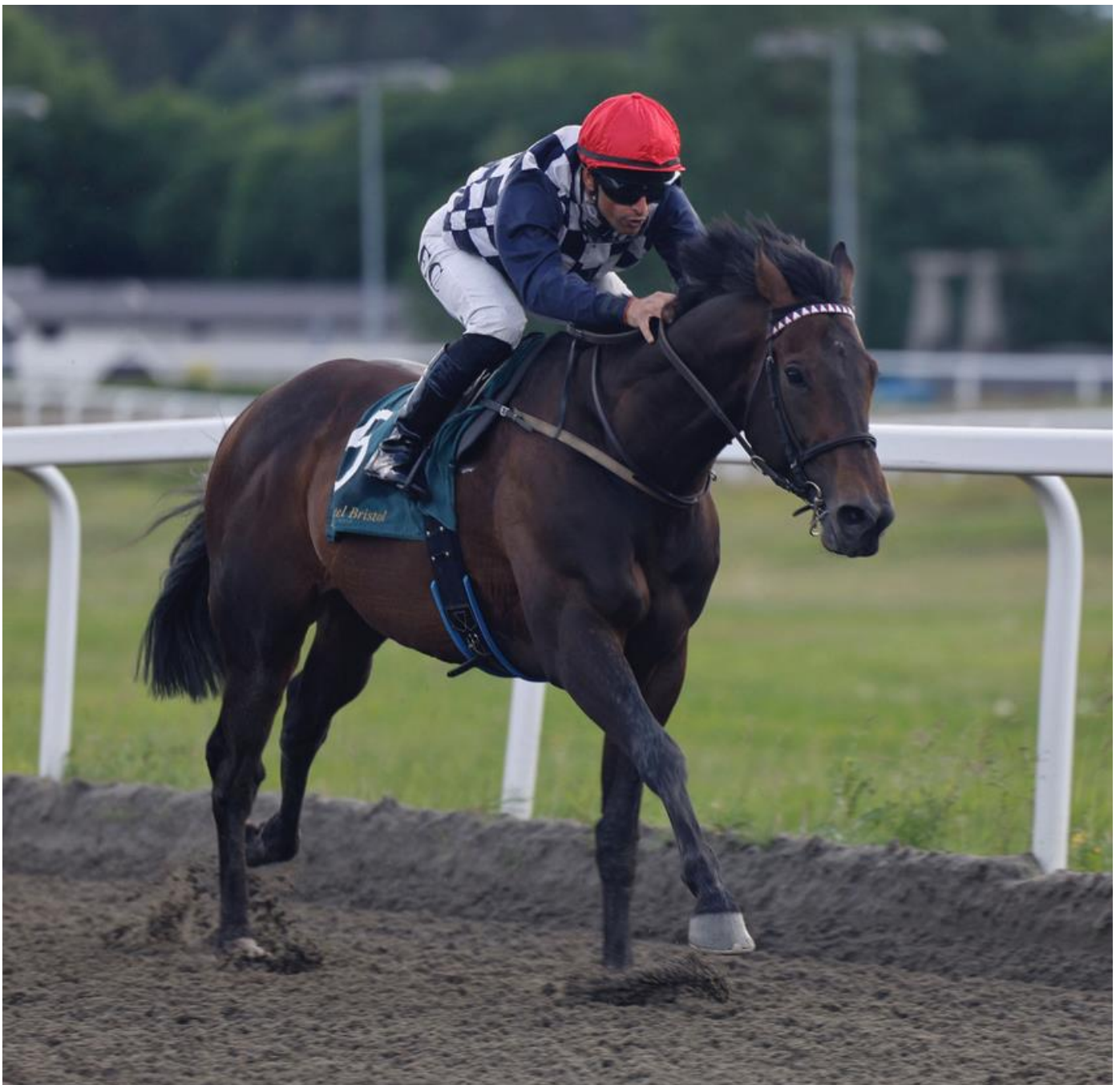
Bilde: Macjack (2016 e Mutajally – Macbeth), norskoppdrettet hest som hittil har vunnet 16 løp og kr 1.490.144. Oppdretter Bollerød Stutteri.

Suffix (bokstaver i parentes bak hestens navn) angir i hvilket land hesten er født. Norskfødte har ikke suffix i Norge. Hester kan være født i utlandet, men allikevel være norskoppdrettet i henhold til gjeldende regler.